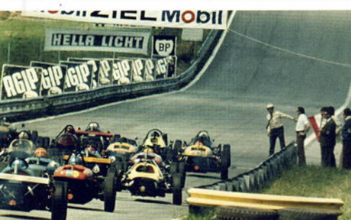
Ö-Ring in alten Ansichten

Die Unternehmungen der Familie Peugeot von 1945 bis 2000