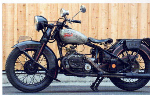
Puch 800 Jubiläum

Sunbeam Open Tourer 1932 – Szeneportrait Friedl – Retromobile Paris – Wiener Baustellen Das Autoradio – Modellflugmuseum Schweiz – Mercedes-Benz W123 – Mille Miglia-Vorschau