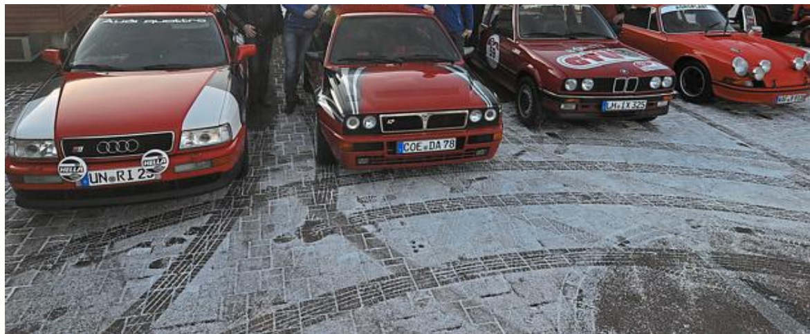
In Südkirchen trafen sich die vier Münsterland-Teams zum gemeinsamen Start in Richtung Monte Carlo. Theo Wellmann (r.) hat die Tour bereits zwölf Mal absolviert.