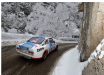
Der Skoda L120 2015 bei der Monte-Histo