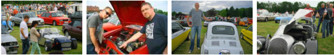
Oldtimer-Treff am Lokal Zum letzten Wolf

Aber nicht nur gegen die Witterung werden sie kämpfen müssen – auch gegen die Zeit. Unterwegs muss er mit seinem Co-Piloten immer wieder Prüfungen absolvieren.